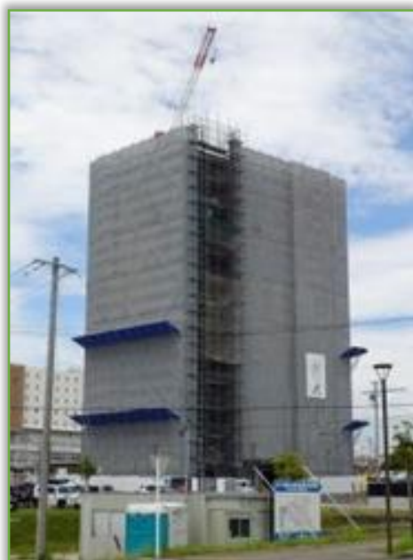
袋井駅前 マンション