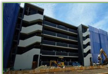
ル・シェモア西草深