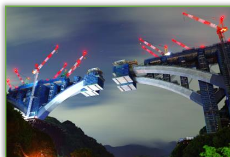
新東名高速道路 河内川橋