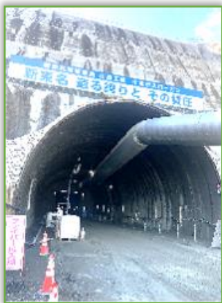
新東名高速道路 谷ヶ山トンネル