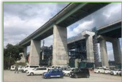
新駒門高架橋(鋼上部工)