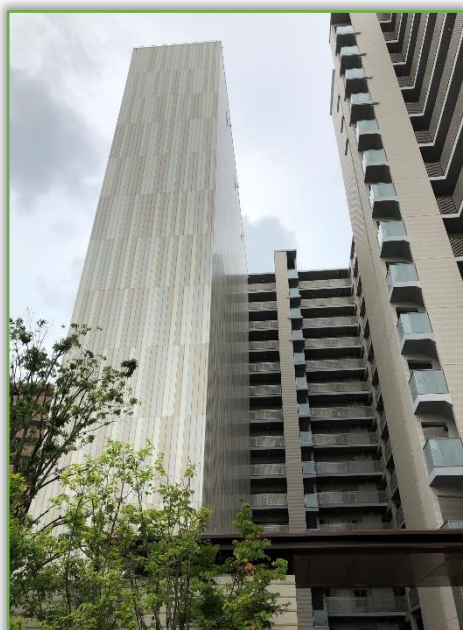
プレミスト常磐町