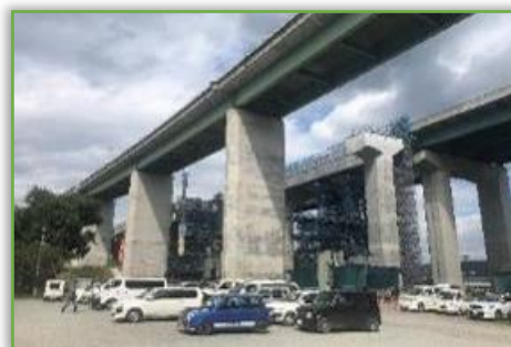
新駒門高架橋(鋼上部工)