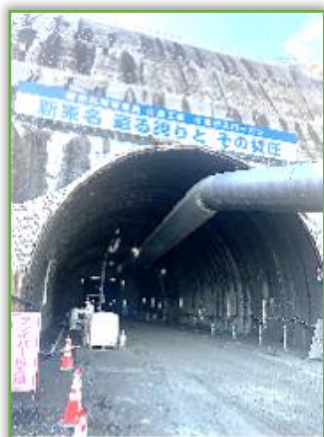
新東名高速道路 谷ヶ山トンネル